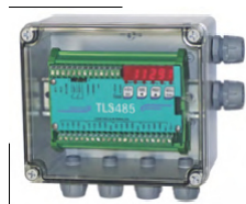
Gehäuse IP 67