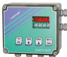
Gehäuse IP 67 mit Fronttasten

Die 2 Eingänge können als Brutto/Netto, Null Stellung, Spitzenwert oder extern via Protokoll genutzt werden.